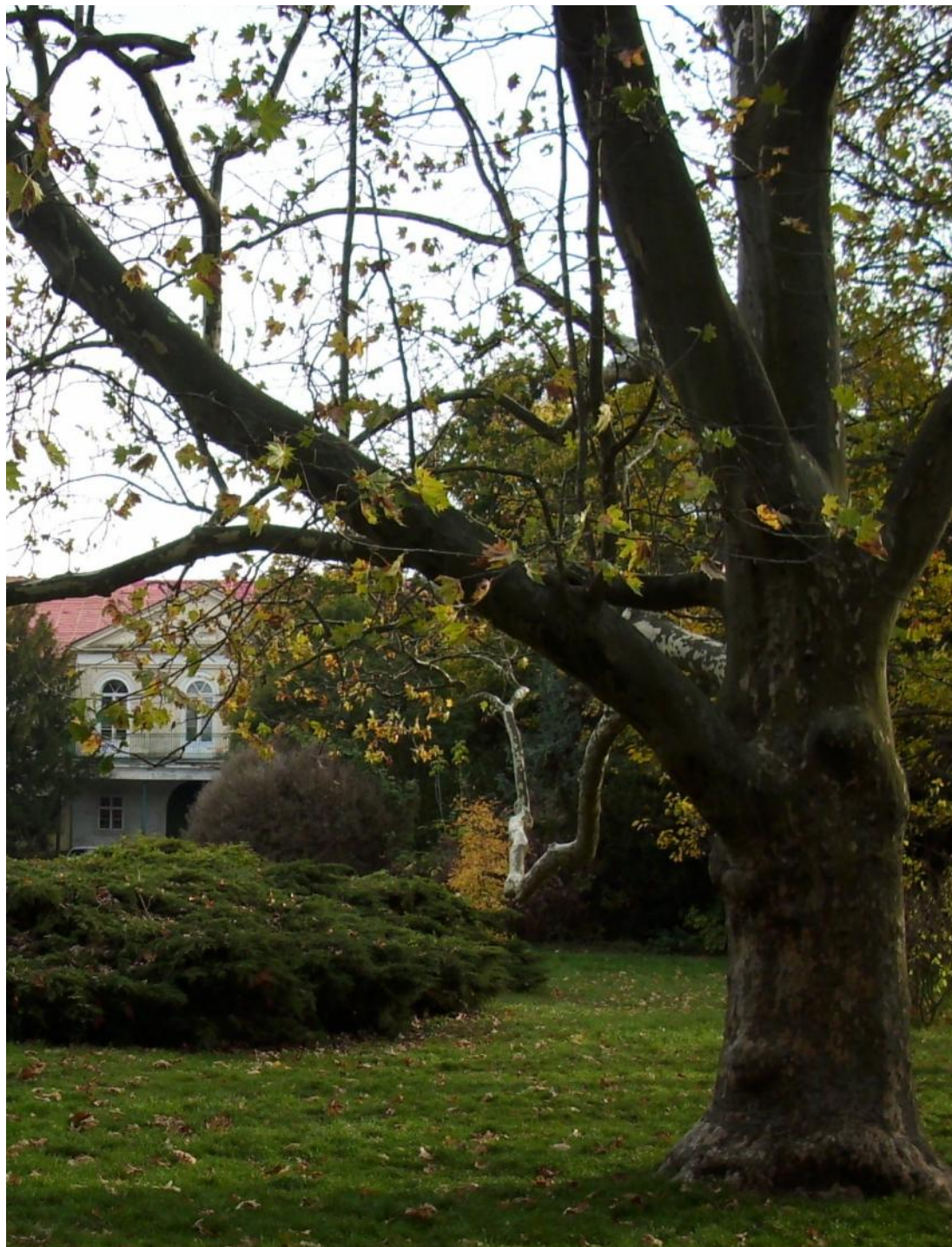
Pohľad do záhrady kaštieľa v Malinove.

Časopis nielen pre tých, ktorí majú radi históriu